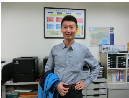
➤ 澳洲新南威爾斯大學博士