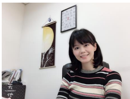
▷日本國立名古屋大學博士(文學)