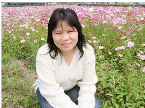
▷日本國立東北大學博士(文學)