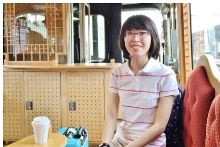
▷日本國立名古屋大學博士