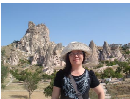
➤ 日本國立筑波大學博士(文學)